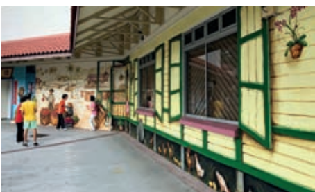
P06 The art of nostalgia