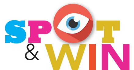
P14 Spot the differences contest