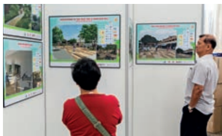
P11 Remaking our heartland